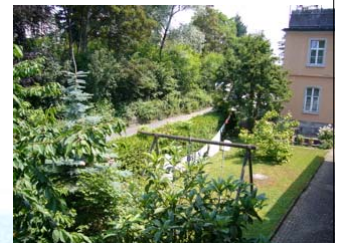
Umfeld des movimento - studios

Die Teilnehmer haben die Möglichkeit, nach Absprache mit Schlafsack und Iso-Matte im Studio zu übernachten. Darüber hinaus gibt es in Konstanz und Kreuzlingen unzählige Übernachtungsmöglichkeiten in Hotels und Jugendherbergen.