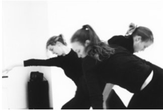
Proben zu „Momentaufnahme“

“Choreographie ist zu 80% Handwerk. Dieses Handwerk lässt sich auf jedes Genre gleichermaßen übertragen anwenden.”